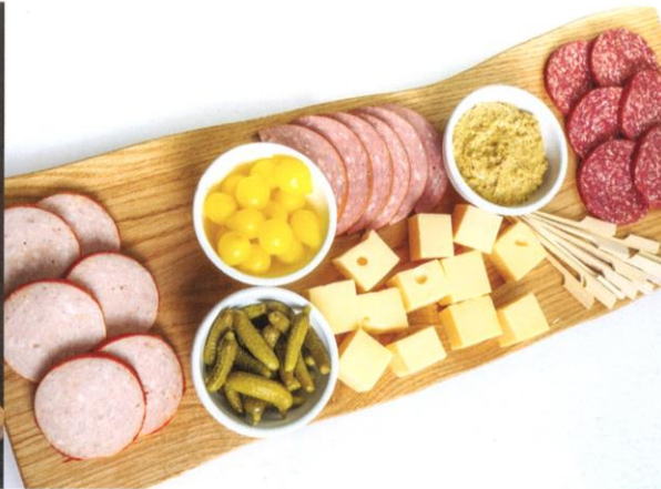
Kaas & worstplateau | grillworst, ossenworst, gekookte worst, Noord-Hollandse jonge/oude kaas, incl. mosterd en zuur | Prijs per 3 stuks (mix) € 3,95