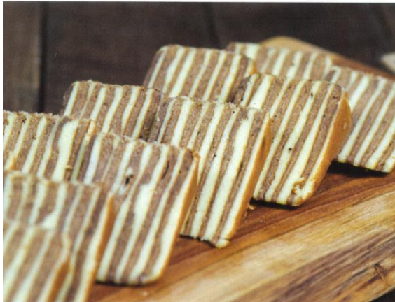
Spekkoek | Prijs per stuk € 1,45