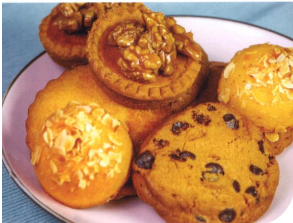
Luxe koek | gevulde koek, walnoot caramelkoek, amandelcake, kokoskoek, westplasje, chocolate chip cookies | Prijs per stuk € 2,35