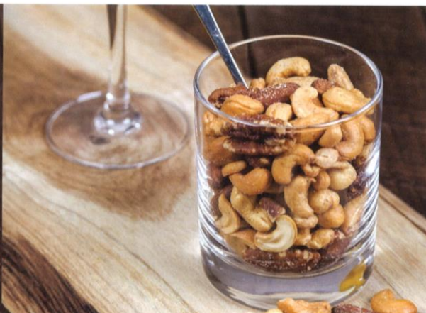
Gemengde noten | Prijs per 4/5 personen € 5,75