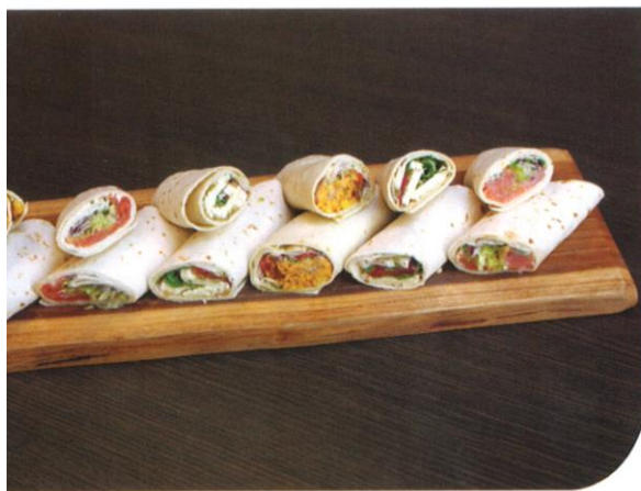
Wraps | (per plank te bestellen van 6 stuks; 12 halve wraps) Cajun kip, gerookte zalm, brie met pesto tapenade | Prijs per plank € 30,00 | Prijs per stuk € 2,55