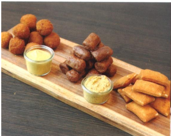
Hollands bittergarnituur ** | kaassoufflés, bitterballen, frikandellen | Prijs per 3 stuks € 3,50