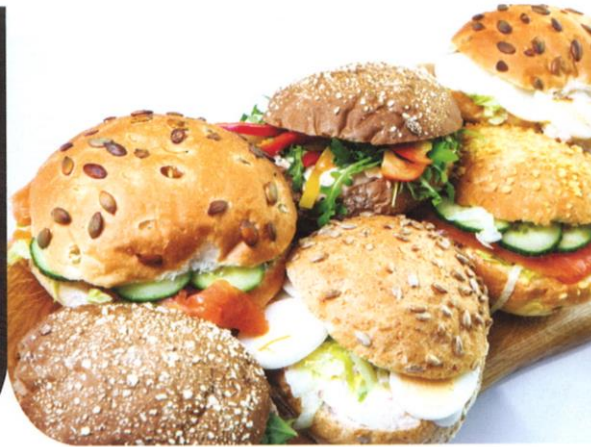
Assorti zachte luxe broodjes | mix van zachte broodjes (bruin/wit) (met en zonder decoratie) 45 gr. beleg: kaas (jong, oud, jong belegen), boerenkaas, boerenham, fricandea, kipfilet, pastrami, Schotse gerookte zalm, tonijnsalade, krabsalade | Prijs per stuk € 3,25