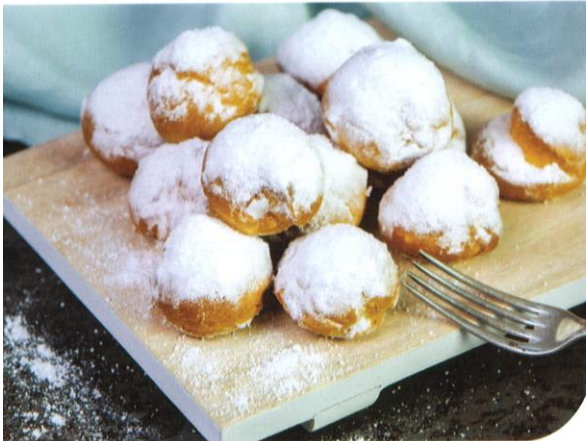
Slagroomsoesjes | Prijs per stuk € 1,25