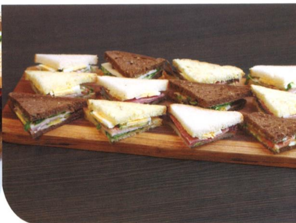
Mini sandwich | (bruin/wit, 2-laags, ter grootte van een kwart boterham) carpaccio met pesto, pijnboompitten & parmezaanse kaas, gerookte kip met bacon en kerriemayonaise, gebraden kalfsmuis met tonijnmayonaise (vitello tonnato), gerookte zalm, crème fraîche met kappertjes tapenade, geitenkaas met honing, walnoot en rucola | Prijs per stuk € 2,55