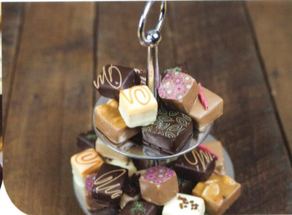
Handgemaakte bonbons | Prijs per stuk € 1,30