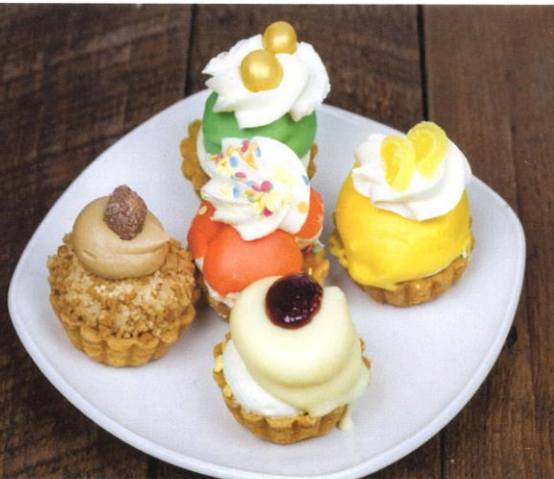
Harde Wener petit fours | Prijs per stuk € 2,75