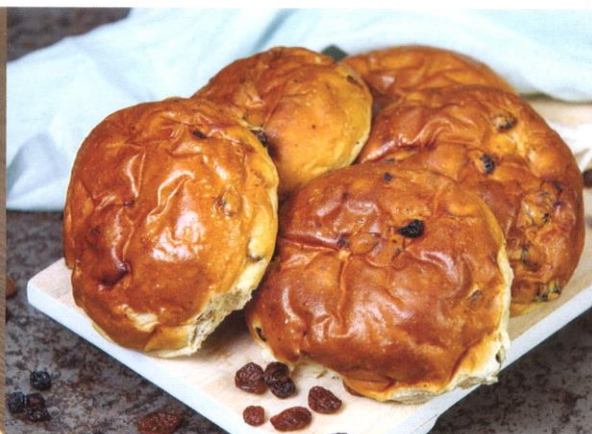
Krentenbol | met boter | Prijs per stuk € 1,80 Krentenbol | zonder boter | Prijs per stuk € 1,55