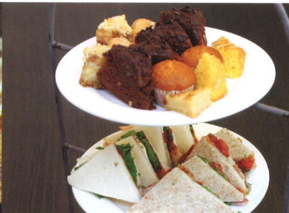
High Tea (vanaf 5 personen) | (te bestellen in een veelvoud van 5) combinatie van diverse zoete en hartige lekkernijen gepresenteerd op etagères. 6 items p.p. waarvan 3 zoet en 3 hartig, o.a. de volgende soorten: sandwich gerookte zalm en roomkaas, sandwich kipfilet met tapenade van zongedroogde tomaat, sandwich oude kaas met mosterddressing, sandwich serranoham met rucola, brownie, slagroomsoesjes, huisgemaakte arretjescake, gevulde mini muffins, roomboterkoekpuntjes, appelpuntjes, divers paleisbanket | Prijs per persoon € 7,55