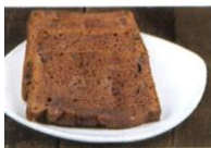
Cake naturel | Prijs per stuk € 1,40 Cake chocolade | Prijs per stuk € 1,40