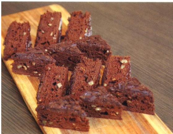
Brownie | Prijs per stuk € 1,50