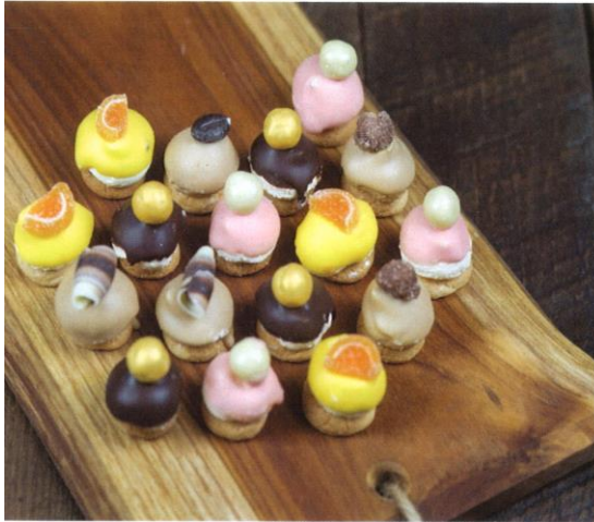
Petit glacé | (te bestellen per 12 stuks) | Prijs per 12 stuks € 21,00 | Prijs per stuk € 1,75