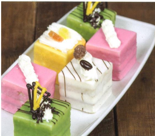
Cake petit fours | Prijs per stuk € 2,75