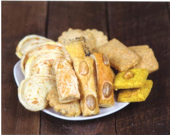
Zoute koekjes | Prijs per stuk € 0,65