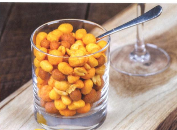
Borrelnoten | Prijs per 4/5 personen € 2,75