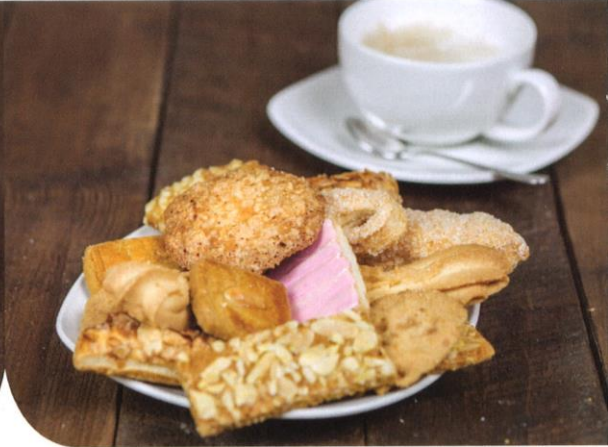
Roomboter allerhande | diverse roomboterkoekjes | Prijs per stuk € 0,60