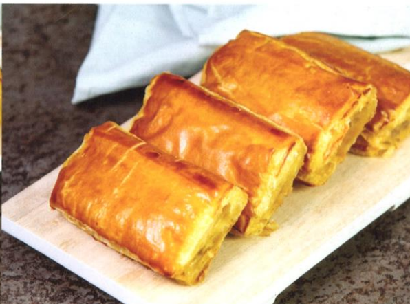
Saucijzenbroodje ** Mini: prijs per stuk € 1,40 Half: prijs per stuk € 1,75 Heel: prijs per stuk € 2,75