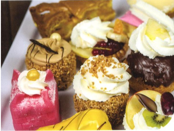
Assorti gebak | appelpunt, kwarkpunt, slagroompunt, hazelnoot schuimgebak | Prijs per stuk € 3,60