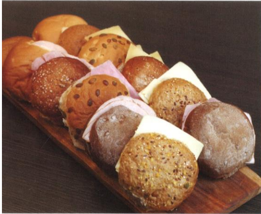
Assorti zachte basis broodjes | bruin/wit gemengd met en zonder decoratie, 30 gram beleg: ham, Noord-Hollandse jonge kaas, kipfilet | Prijs per stuk € 2,55