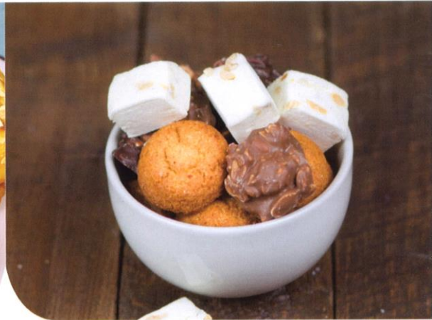
Klein koffielekkers | (te bestellen per 3 stuks) noga, bitterkoekje, pindarotsje | Prijs per 3 stuks € 1,65 | Prijs per stuk € 0,55