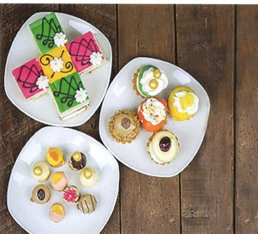
Portie overzicht petit glacé, harde Wener petit fours & cake petit fours