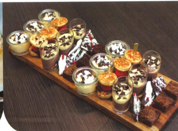
Koffie moments* | (te bestellen per 30 stuks) chocolademousse, koffietrifle, sandwich van poffertjes & aardbei, chocolade brokken, wortelkoek met vanille hangop | Prijs per 30 stuks € 37,50 | Prijs per stuk € 1,25