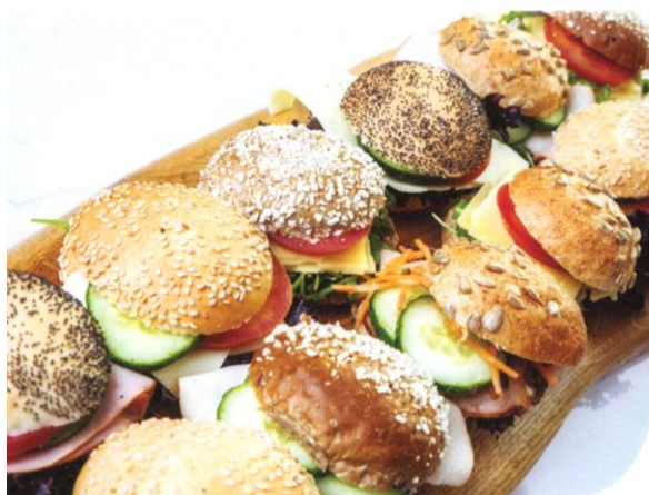
Assorti zachte luxe mini broodjes | diverse mini broodjes beleg met: kaas (jong, oud, jong belegen), boerenkaas, boerenham, fricandea, kipfilet, pastrami, Schotse gerookte zalm, tonijnsalade, krabsalade | Prijs per stuk € 2,75