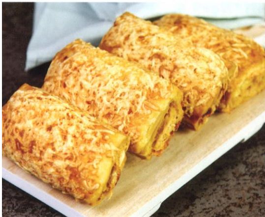
Kaasbroodje ** Mini: prijs per stuk € 1,40 Half: prijs per stuk € 1,75 Heel: prijs per stuk € 2,75