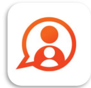
Konnnect OuderApp Konnnect B.V.

Gegevens niet ontvangen? Neem dan contact op met de afdeling Planning&Plaatsing van de opvang van Allente, zij kunnen deze gegevens sturen.