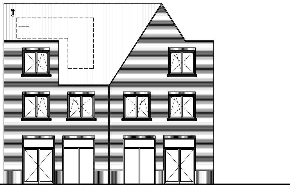
7000 7000 Woningtype B1 (Bwnr 2, 6 & 10) Woningtype B (Bwnr 1, 5 & 9) Achtergevel