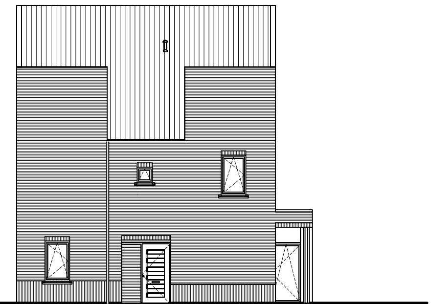
10500 1500 Woningtype B (Bwnr 1, 5 & 9) Linker zijgevel