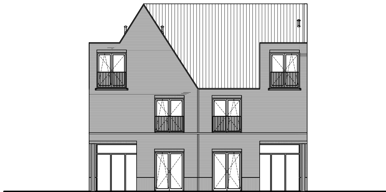
7000 7000 Woningtype B (Bwnr 1, 5 & 9) Woningtype B1 (Bwnr 2, 6 & 10) Voorgevel