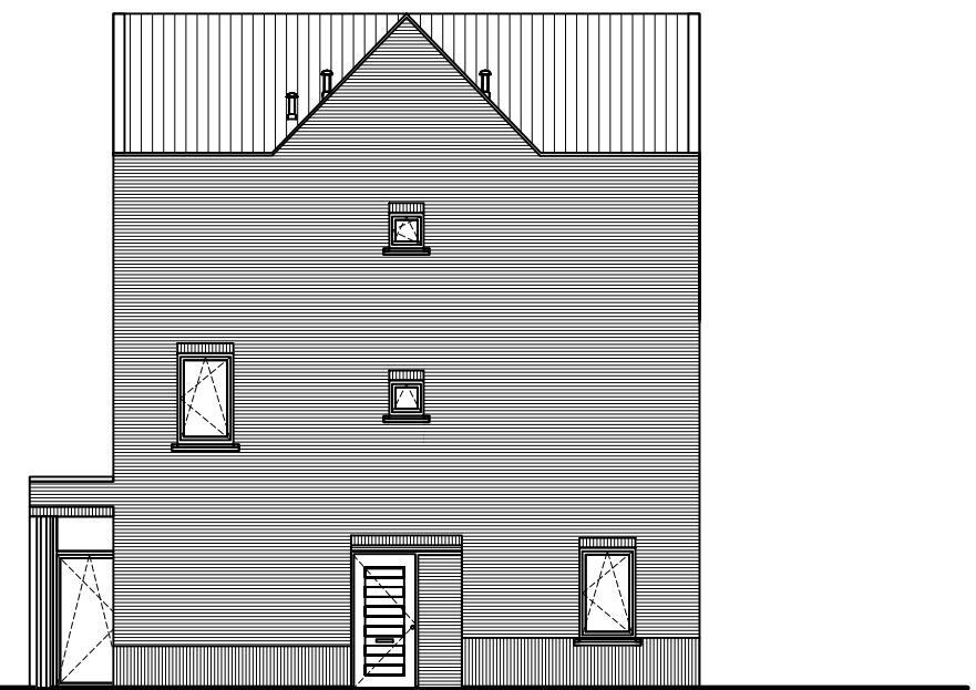
1500 10500 Woningtype B1 gesp (Bwnr 2, 6 & 10) Rechter zijgevel