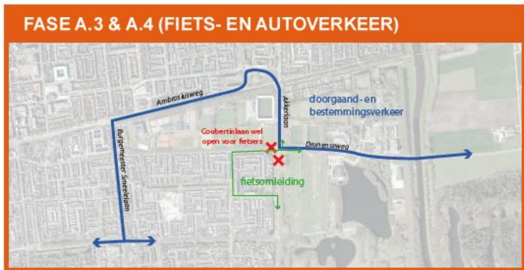
Omlidingsroute fase A.3